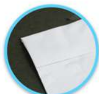
Lipat Pas Gambar