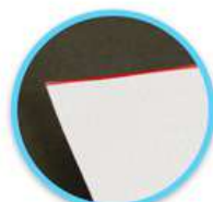
Potongan Pas Gambar